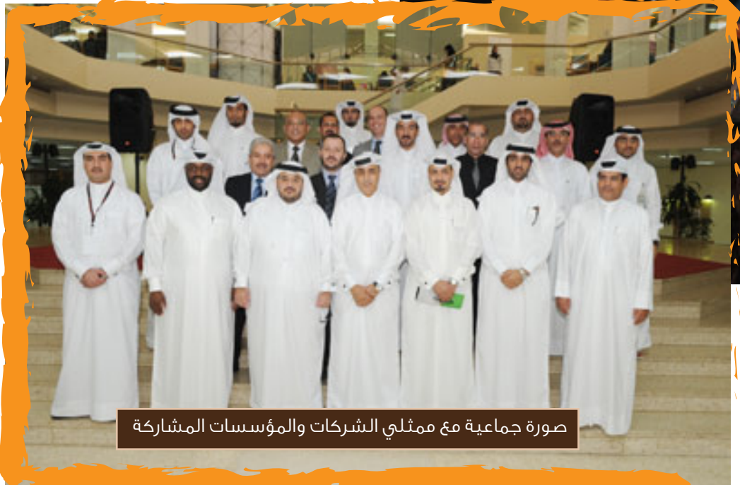
صورة جماعية مع ممثلي الشركات والمؤسسات المشاركة